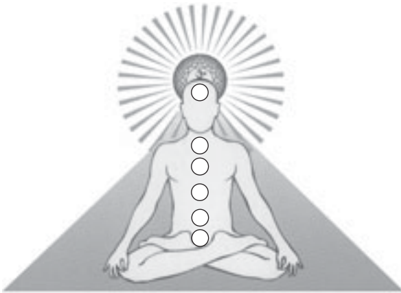
Погруженный в себя Мастер, созерцающий Бога

Пирамида символизирует и погруженного в себя человека в позе медитации.