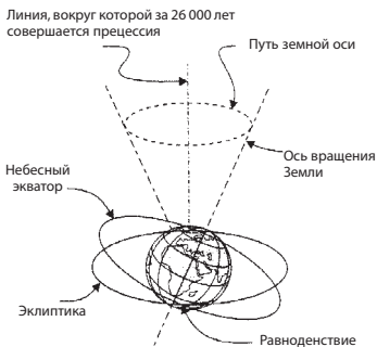
Рис. 2. Схема прецессии

Как такое может быть? В своей книге «Древняя тайна Цветка Жизни» я предлагаю ответ на этот вопрос, но здесь не буду приводить эту информацию, поскольку она не имеет непосредственного отношения к нашему рассказу.