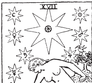
Звезды как планеты

справа и три слева. Исходя из положения Адама и Евы в карте Влюбленные , правая сторона — мужская, а левая — женская.