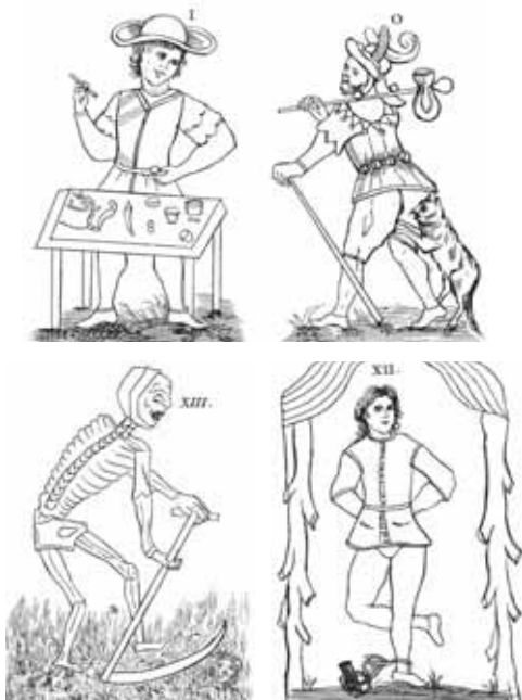
Иллюстрации из книги Кура де Жебелена

Продолжил традицию оккультного Таро другой француз, Жан-Батист Альетт (1738 – 1791), более известный под «каббалистическим» псевдонимом Эттейлла. Он впервые в документированной истории: